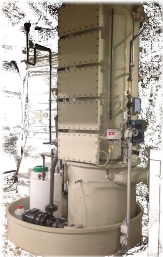
Düsenbodenwäscher für flüchtige Kohlenwasserstoffe aus Reinigungsprozessen