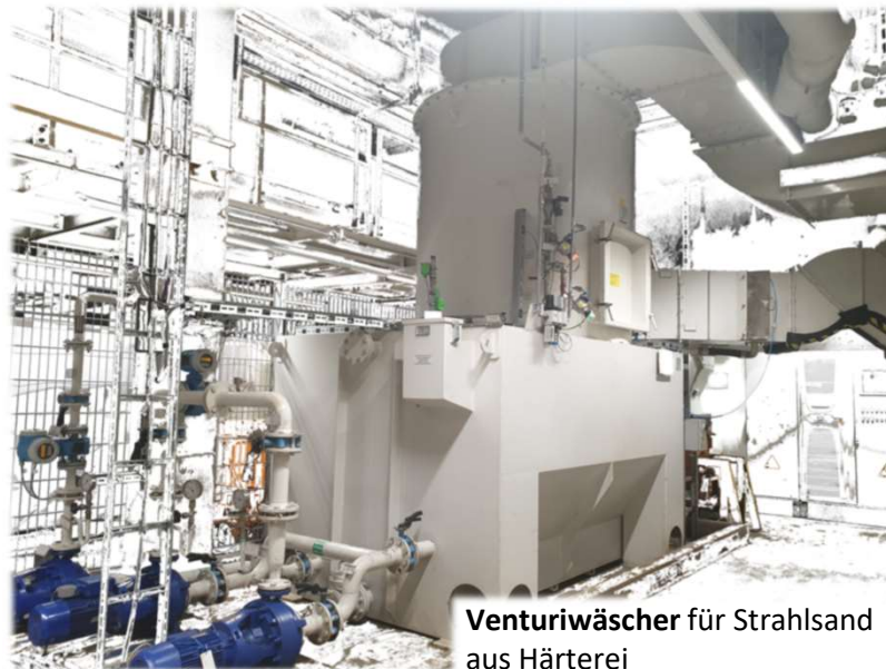
Venturiwäscher für Strahlsand aus Härtereie