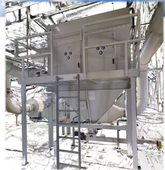
MMS*-Abscheider für Metallstäube mit Kühlschmierstoff aus der Metallverarbeitung