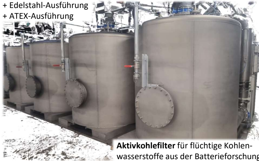
Aktivkohlefilter für flüchtige Kohlenwasserstoffe aus der Batterieforschung

+ Edelstahl-Ausführung + ATEX-Ausführung