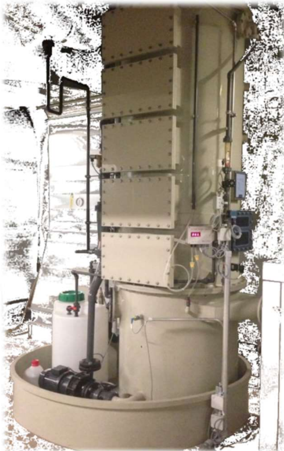
Düsenbodenwäscher für flüchtige Kohlenwasserstoffe aus Reinigungsprozessen